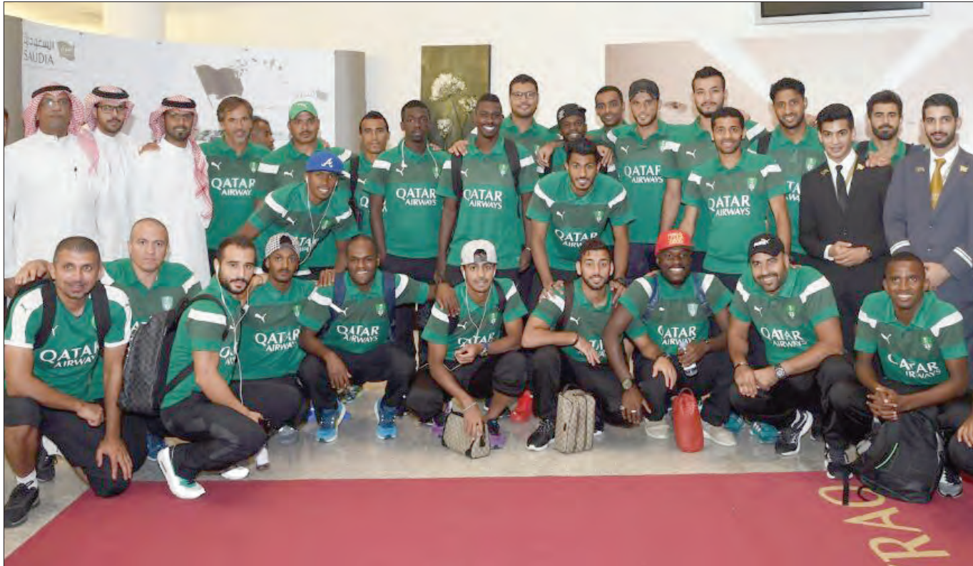
فريق الأهلي لدى المغادرة إلى الدمام لملاقاة الاتفاق

لتنقلات البطل. وتأتي هذه الخطوة كأحد بنود اتفاقية رعاية الخطوط السعودية للكرة السعودية لتخص بها بطل دوري جميل في كل موسم.